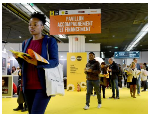
Allée centrale du Salon SME Photo prise au Salon SME 2019

Cette année, l'événement sera hybride c'est-à-dire organisé à la fois en présentiel et sur le web. Concrètement, les entrepreneurs pourront choisir de poser leurs questions aux experts des exposants, soit au Palais des Congrès de Paris, soit par tchat ou visio, via un salon virtuel et donc sans avoir à se déplacer. Ils pourront de même assister aux conférences en salle ou sur leur PC.