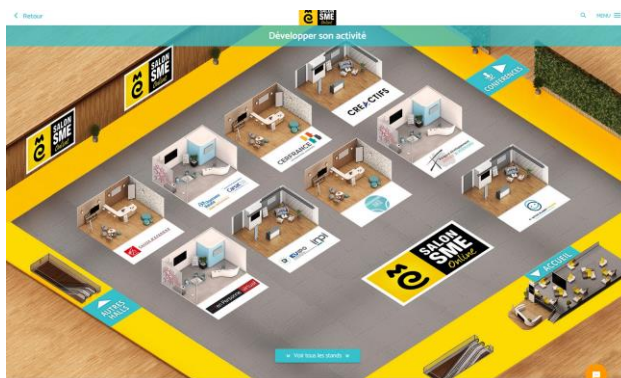
Hall d'exposition du salon virtuel Photo communiquée à titre d'exemple