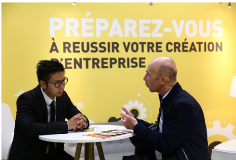
Stand Bpifrance Création (Salon SME Paris 2019)