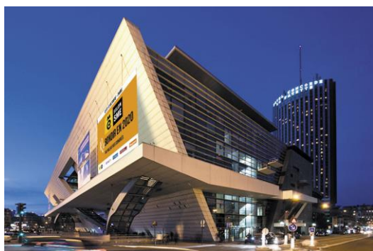
Palais des Congrès de Paris

Depuis 1999, chaque année, début octobre, le Salon SME invite les freelances, créateurs et dirigeants de TPE à venir découvrir au Palais des Congrès de Paris toutes les solutions pour créer, gérer et développer leur entreprise.